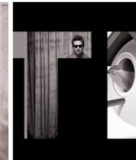
TODO ES POLÍTICA (2007)